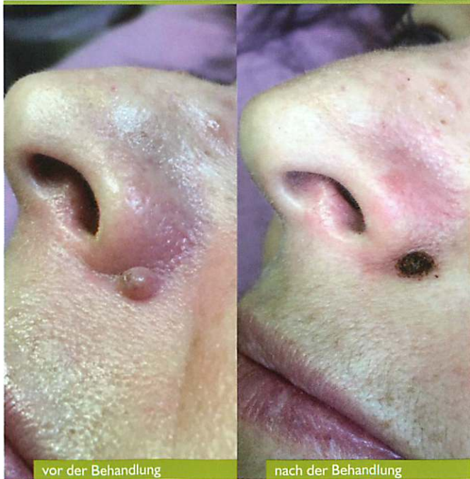
7 Tage Abheilungsprozess

PLASMAGE ® nutzt die Ionisierung der uns umgebenden Luft (speziell Sauerstoff u. Stickstoff). Das entstehende Plasma sublimiert die obersten Hautschichten, ohne die Dermis zu schädigen. Gleichzeitig werden vorhandenen Keime abgetötet und somit eine schnelle Heilung ohne Narbenbildung oder Infektionen ermöglicht.