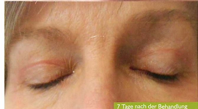
7 Tage nach der Behandlung