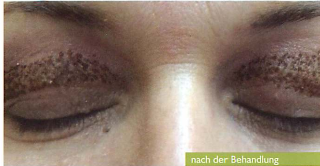
nach der Behandlung