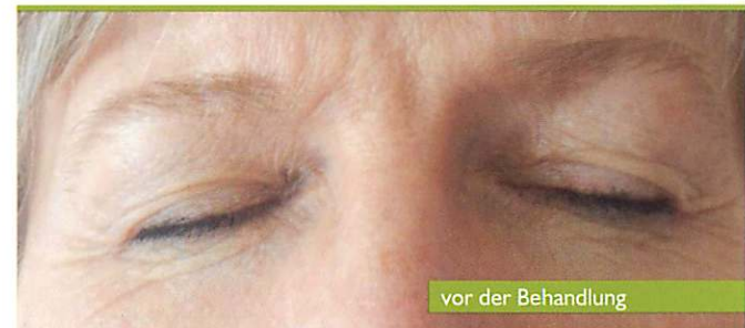
vor der Behandlung

ist eine überzeugende Innovation auf dem Schönheitsmarkt. Diese sicherheitsgeprüfte Technik (CE zertifiziert) wird bereits in vielen Ländern Europas und in den USA sehr erfolgreich eingesetzt.