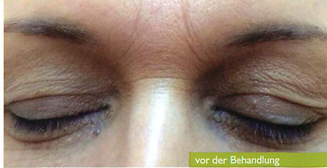
vor der Behandlung