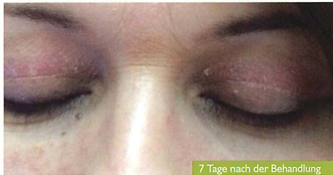
7 Tage nach der Behandlung